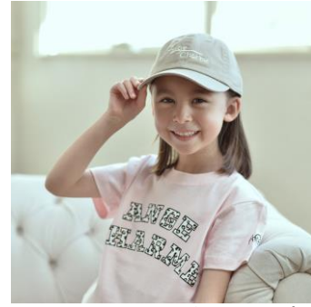
オリジナルロゴキャップ キッズ/3色展開/フリー 2,800円（税抜） ※大人リンクアイテムあり