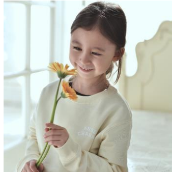
カレッジロゴスウェット キッズ/3色展開/3サイズ 3,500円（税抜） ※大人リンクアイテムあり