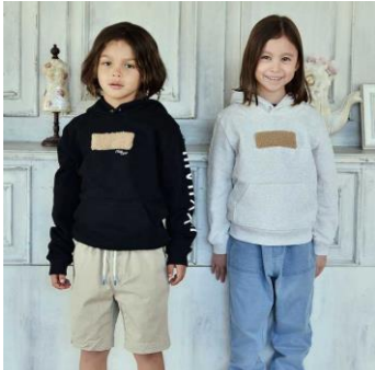
キュートベアファーパーカー キッズ/2色展開/3サイズ 3,900円（税抜）

第一弾として、2020年12月21日（月）15：00より、計15アイテムをSHOPLIST限定で販売いたします。